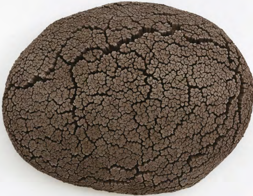
Terre, 2017, Faïence, Oeuvre réalisée avec Sylvain Rieu-Piquet © Émile Vialet